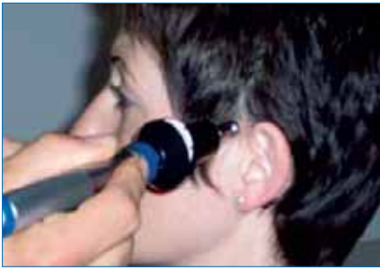
Abb. 5: Behandlung Gb (YNSA)