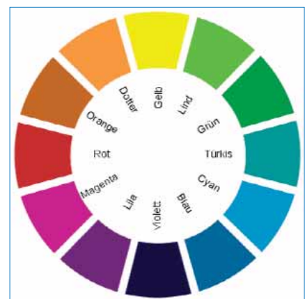
Abb. 2: 12-teiliger Farbkreis (harmonisch)

Mischt man Blau und Gelb, erhält man Grün (Abb. 2). Grün wirkt harmonisierend und ist eine häufige Therapiefarbe. Grün steht für Konzentration, exakte Analyse und konsequente Logik. Grün ist eine wichtige Farbe, um auf den Stoffwechsel einzuwirken.