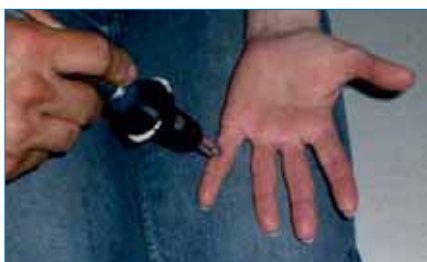
Abb. 4: Behandlung F9 (Koreanische Handakupunktur)

die optimale Farbe ermittelt ist. Grundsätzlich können aber auch alle anderen Testmethoden eingesetzt werden.