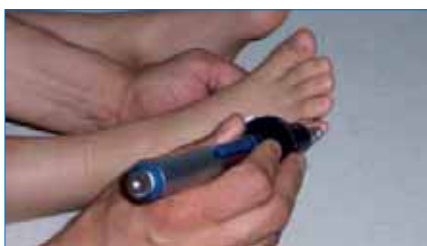
Abb. 3: Behandlung Blase 67 (klass. Akupunkturpunkt)

Kinesiologie, RAC nach Nogier, Elektroakupunktur nach Voll oder z. B. der Einsatz des Biotensors. In meiner Praxis kommt die Kinesiologie als Testmethode zum Einsatz. Sie bietet aus meiner Sicht den großen Vorteil, dass der Patient direkter beteiligt ist. Durch den kinesiologischen Muskeltest zeigt sein Körper, sprich: sein Arm, ob die ihm angebotene Farbe die jetzt einzusetzende Therapiefarbe ist oder nicht. Hierbei zeigt der „starke“ Patientenarm die richtige Farbe an, ein „schwacher“ fordert auf, die Austestung fortzusetzen, bis